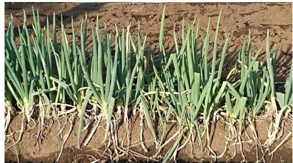
最初に植えた葱。もうすぐ収穫です。

平成29年の1月の終わり、突然父が体調をくずして入院。それまで父が大切に手入れしていた70㎡ほどの家庭菜園が突然ぼつんと取り残されてしまいました。借りている畑ですが父の大きな楽しみ