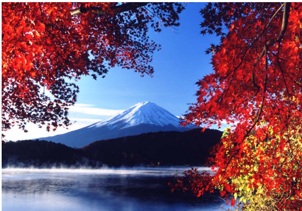
富士河口湖紅葉まつり