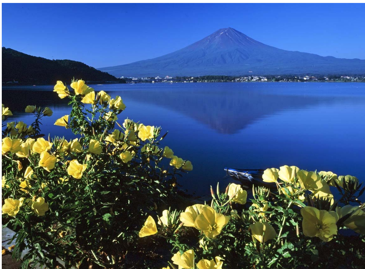
富士山と月見草（河口湖北岸より）